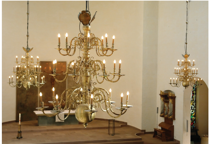
5 pav. Korpusinis voro formos sietynas. XVII a. Šv. Onos bažnyčia Brėmene. Vokietija

Tęsiant skaidriųjų ir trapiųjų medžiagų sietynų raidos apžvalgą, ne-