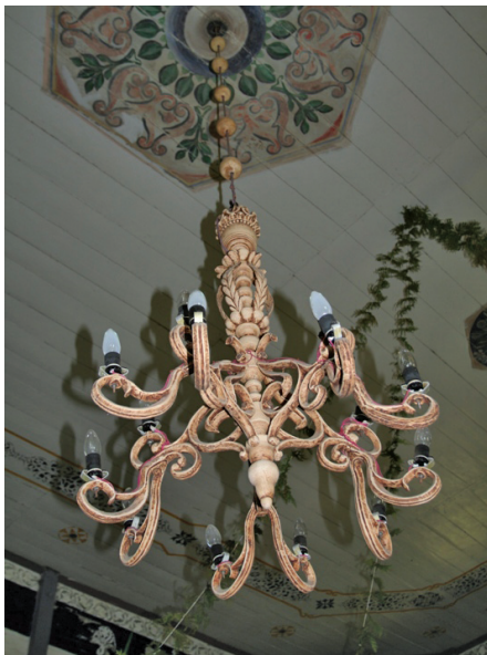
21 pav. Medinis sietynas Gintališkės Šv. Apaštalo evangelisto Mato bažnyčioje (Plungės r.) XIX a.

Retesni, netradicinių formų ir medžiagų sietynai. Lietuvoje esama pavienių vertingų sietynų, kurie dėl savo išskirtinės formos nepatenka į ankstes-