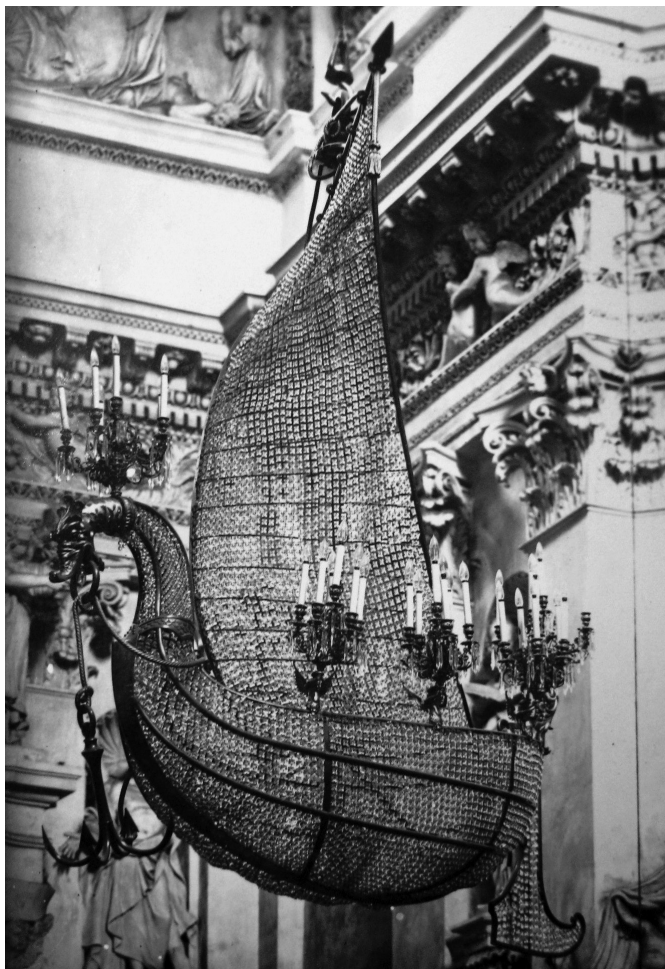
23 pav. Šv. Apaštalo Petro laivo formos sietynas Šv. Petro ir Pauliaus bažnyčioje Vilniuje.