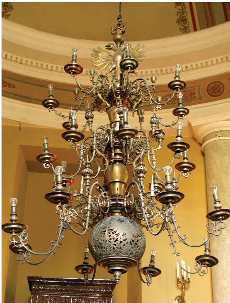
13 pav. Sietynas Šv. vysk. Stanislovo ir Šv. Vladislavo Arkikatedros Bazilikos zakristijoje. XVII a. (Priklauso Lietuvos dailės muziejui TM-531).