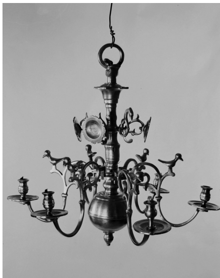
12 pav. Sietynas. XVII a. Lietuvos nacionalinis muziejus. Inv. nr.: IM-4621.

Stikliniai sietynai. Kaip parodė Europos sietynų raidos istorija, nuo XVI a. pradedami gaminti sietynai iš stiklo, o jų klestėjimas – 17 ir 18 šimtmečiais. XVIII a. Italijoje gaminami spalvoto stiklo sietynai, Bohemijoje – stikliniai korpusiniai, bei stiklo karuliais puošti – Marijos Teresės tipo, Anglijos, Ispanijos ir Airijos dirbtuvėse kuriami korpusiniai – barokines olandiškas formas atkartojantys sietynai. Nors ir negalime pasigirti tokių sietynų gausa ir formų įvairove kaip kaimyninėse šalyse [39], tačiau keletą išlikusių stiklinių sietynų turime ir Lietuvoje. Žemaičių