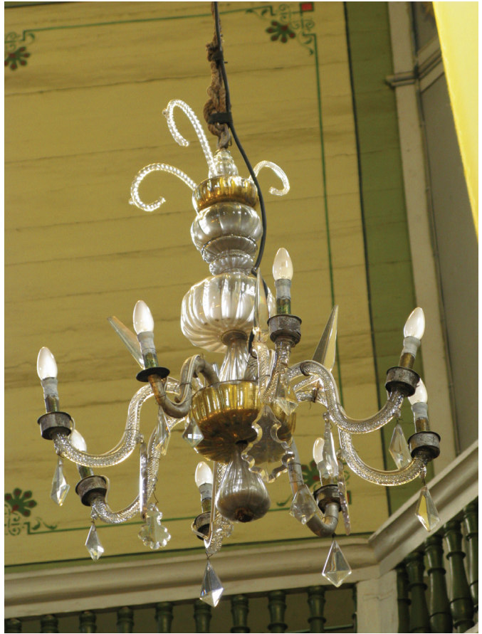
16 pav. Sietynas Griškabūdžio Kristaus Atsimainymo bažnyčioje. XVIII a. II p. arba XIX a. II p.

Visiškai kitoks Marijos Teresės sietynų tipas populiarus Europoje nuo XVIII a. vidurio. Kaimyninėje Lenkijoje tokio tipo sietynai taip pat buvo gaminami XVIII a. [42]. Marijos Teresės tipo sietynų turime ir Lietuvoje. Kultūros vertybių registre į kilnojamų dailės paminklų sąrašą įtraukti Kelmės rajono Maironių kaimo Švč. Mergelės Marijos bažnyčios XVIII a. pabaigos [43], Joniškio rajono Juodeikių kaimo Šv. Jono Krikštytojo bažnyčios XIX a. pirmosios pusės [44] sietynai, bei savo forma pats įmantriausias Alytaus apskrities Ratnyčios kaimo Šv. apaštalo Baltramiejaus bažnyčios sietynas [45]. Lietuvos TSR kultūros paminklų sąrašo duomenimis sietynas pagamintas XIX amžiuje [46] (17 pav.). Kaip ir būdinga Marijos Teresės tipui, sietynas turi pagrindinį kamieną, bei jį gaubiantį metalinių strypelių karkasą, ant kurio puikuoja gausybė stiklinių arba krištolinių pakabukų. Nušlifotos arba formoje išlietos žvaigždės su spinduliais ir gėlių pavidalo rozetės dar labiau praturtina puošybą bei paslepia pakabukų pritvirtinimo prie atramų vietas. Sietynas iš kitų to paties tipo sietynų išsiskiria tuo, kad žvakių lizdai išdėstyti trimis skirtingo aukščio lygiais. Karkasas nukaltas augaliniais motyvais,