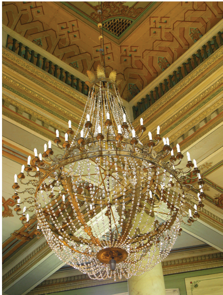
19 pav. Sietynas Griškabūdžio Kristaus Atsimainymo bažnyčioje. XIX a. 3 kvė.

Kaip matyti, daugiausia ampyro stiliaus sietynų Lietuvoje išliko sakraliniuose interjeruose – gali būti, kad tai lėmė didžiulio skersmens sietynų tin-