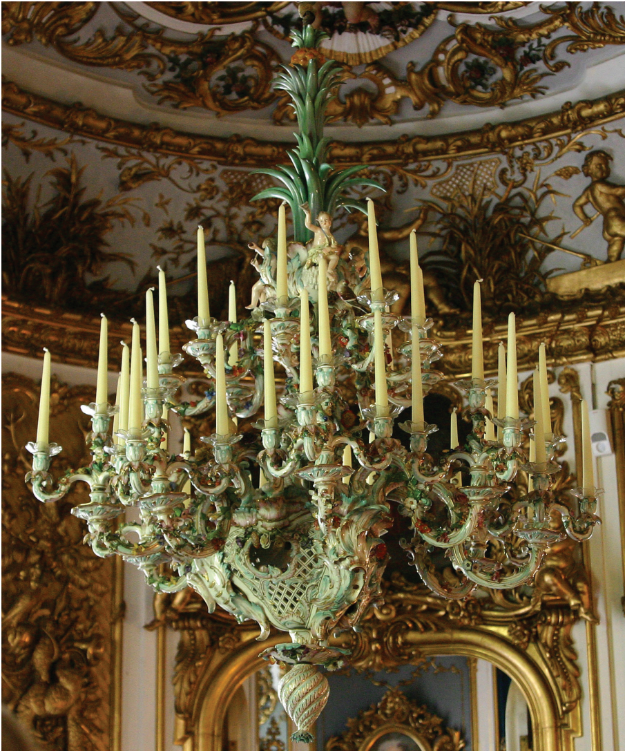
9 pav. Porcelianinis sietynas Linderhof rūmų valgomajame. Vokietija