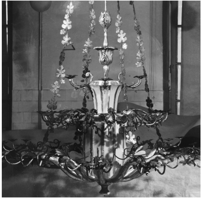
20 pav. Sietynas. XIX a. Lietuvos dailės muziejus. Inv. nr.: TM-521. Sietyno paso nr. 82.2. Tm-521.293.1022