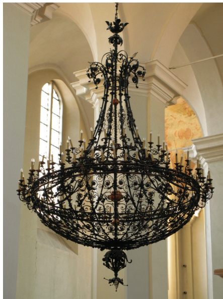
22 pav. Vienas iš trijų (didžiausias) XIX–XX a. sietynas Šv. Jono bažnyčioje Vilniuje.