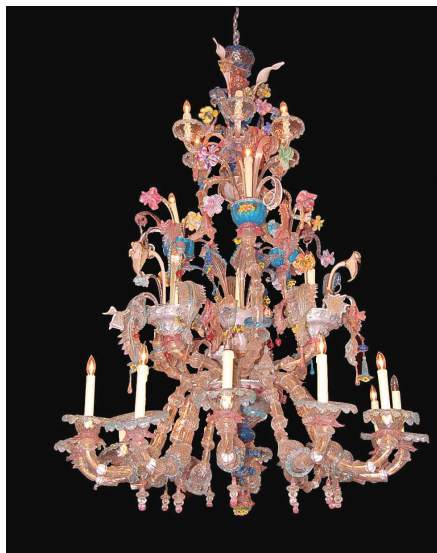
6 pav. Venecijietiškas Murano stiklo sietynas chiocche . XIX a.

(Reprodukuota iš: St. Ans church, Bremen (interaktyvus) Wikimedia (žr. 2009 04 15). Prieiga per internetą: < http://commons.wikimedia.org/wiki/ile:StAnsgariiBremen-08a.jpg >)