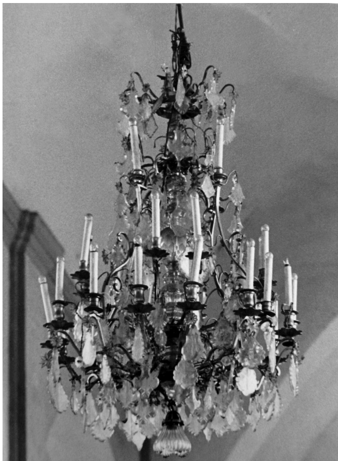
17 pav. XIX a. Marijos Teresės tipo sietynas Ramyčios Šv. Apaštalo Baltramiejaus bažnyčioje. J. Grambos nuotr. (Kultūros paveldo centro Duomenų skyriaus, kilnojamųjų objektų poskyrio kartoteka)