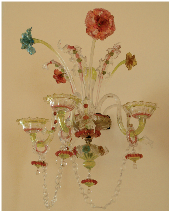
14 pav. Veneciško stiklo sietyno dalys. Žemaičių muziejus „Alka“.